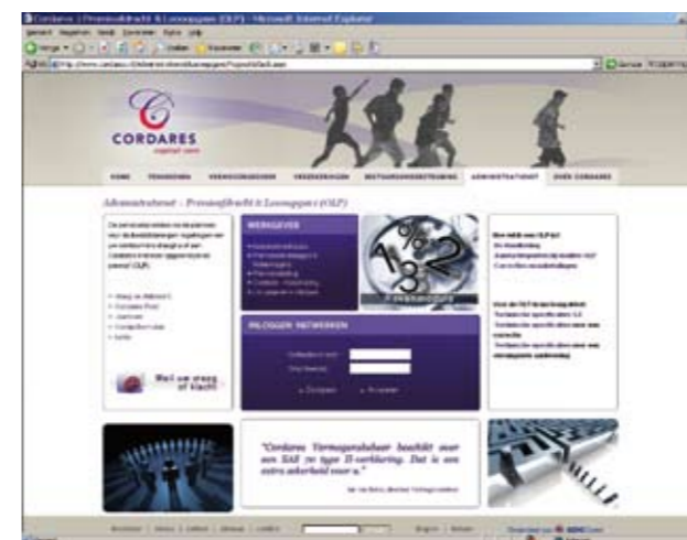
Vernieuwde administratienet landingpage Opgave Loon&premie

Dat kan u bijna niet ontgaan zijn. Door een nieuw uiterlijk kunt u makkelijker alle relevante informatie vinden. Hebt u toch nog enkele tips en verbeteringsuggesties laat ons dit dan weten. Stuur een e-mail naar werkgeversdiensten@cordares.nl .